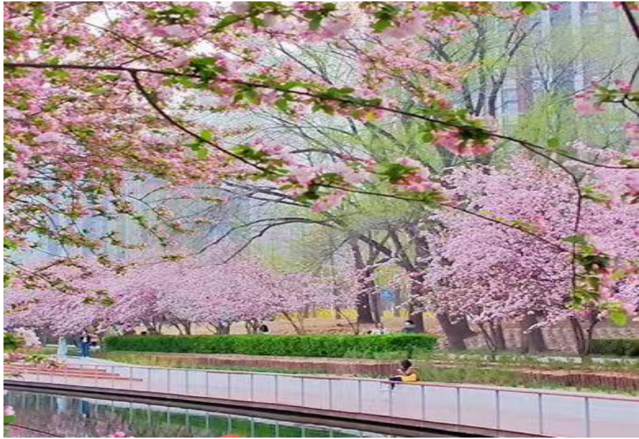
图 5 景观提升—望京沟海棠花溪