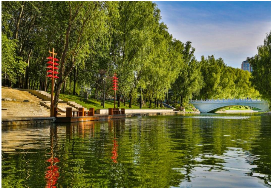
图 3 亮马河通航延伸白浮堰记