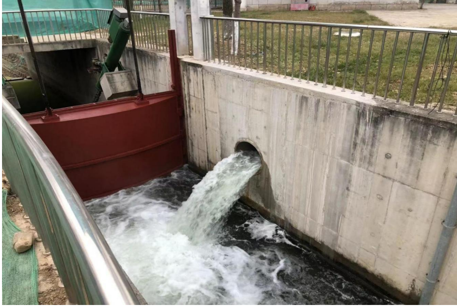
图 7 引调水工程一调引清河水至清洋河