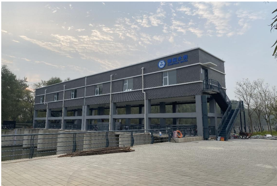
图 8 闸房标准化改造一通惠排干闸房