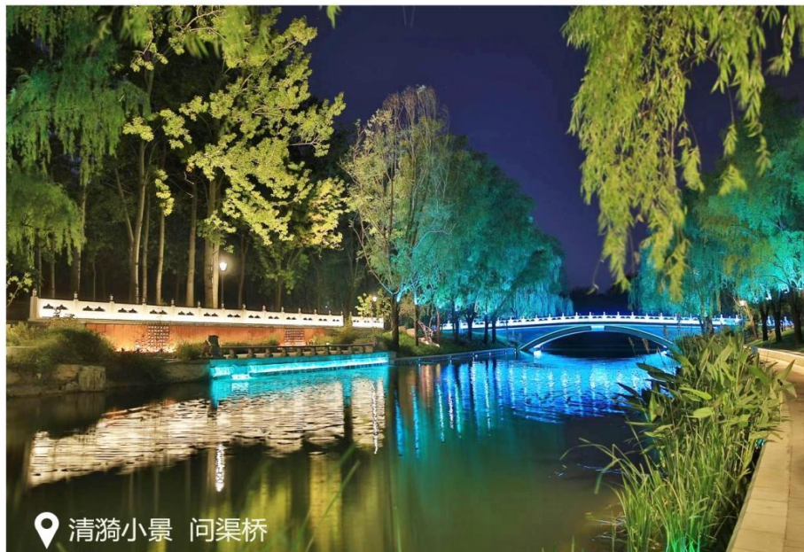
图 4 亮马河通航延伸清漪小景夜景