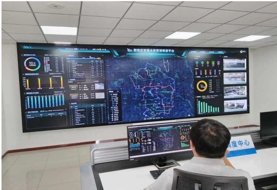
图 6 水系连通智慧调度系统