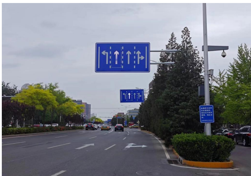
望京北路可变车道