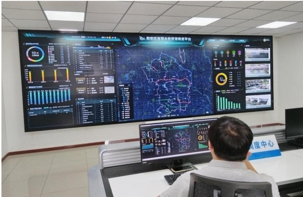
图 6 水系连通智慧调度系统