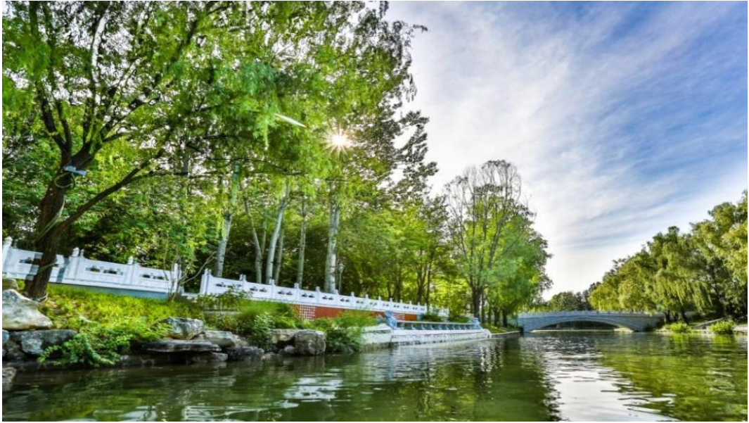
图 2 亮马河通航延伸清漪小景日景