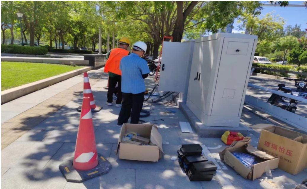
广顺北大街信号灯设备调试