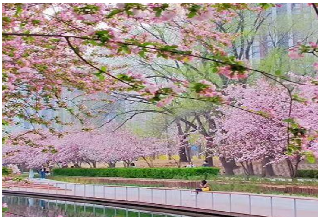
图 5 景观提升一望京沟海棠花溪