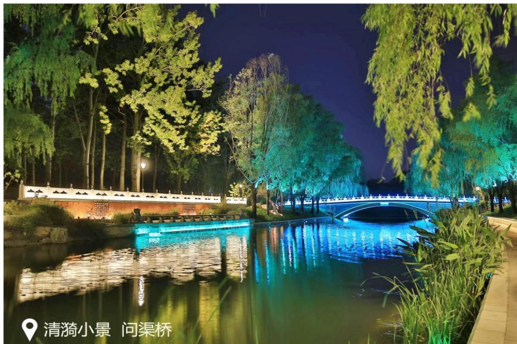
图 4 亮马河通航延伸清漪小景夜景