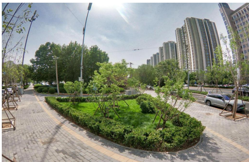
宏昌路与宏泰西路异形路口改造

3.健身大外环（三标段）：完成主体建设及绿化种植工作，实现慢行连通，正在进行节点彩绘及小品安装。完成进度的 80%；目前完成总体进度的 80%，预计年底完工。