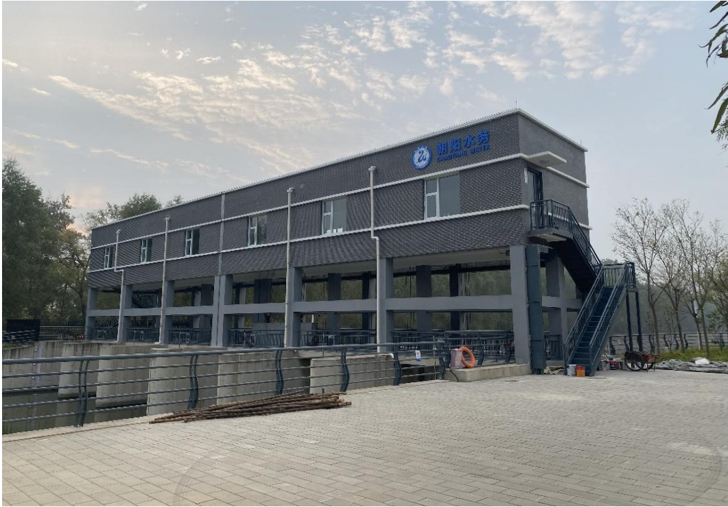
图 8 闸房标准化改造—通惠排干闸房