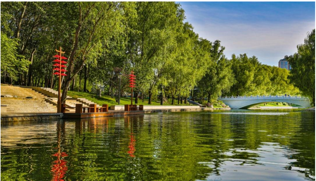
图 3 亮马河通航延伸白浮堰记