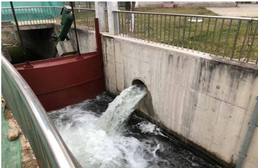
图 7 引调水工程—调引清河水至清洋河