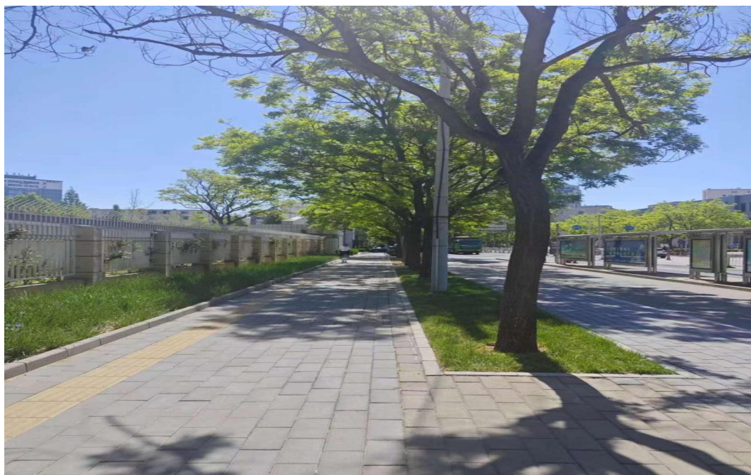
花家地街树池连通